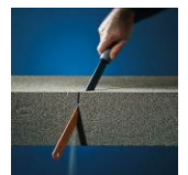
Leicht zu bearbeiten